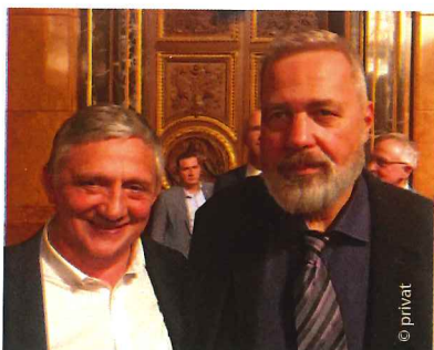
Überraschungstreffen mit Dmitri Muratov, Chefredakteur Novaja Gazeta